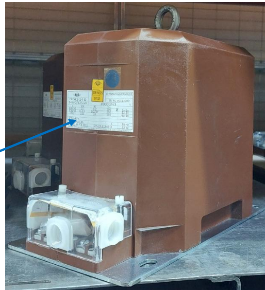
fig. nr. 1