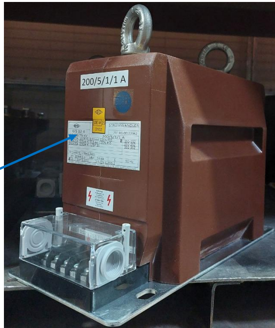
fig. nr. 1